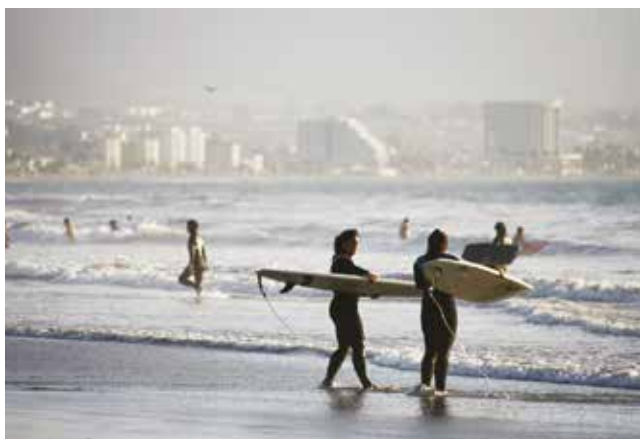
Arriba Club La Serena Golf. Abajo Surfistas Avenida del Mar .