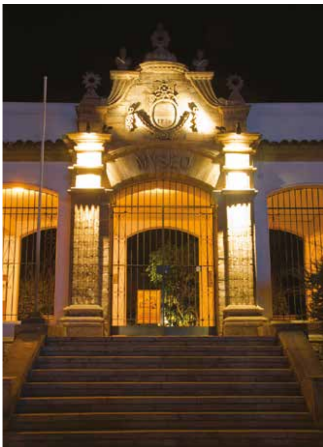
Arriba Museo al Aire Libre, Avenida Francisco de Aguirre. Abajo Frontis Museo Arqueológico.