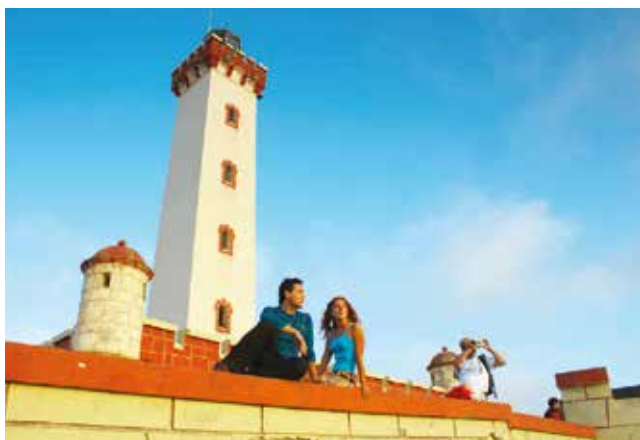
Arriba Sector Cuatro Esquinas, Avenida del Mar. Centro Paseo Avenida del Mar. Abajo El Faro, Monumento Nacional.