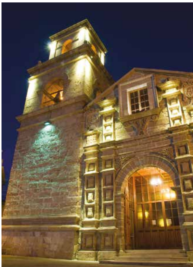
Arriba Iglesia Santo Domingo. Abajo Frontis Iglesia San Francisco.