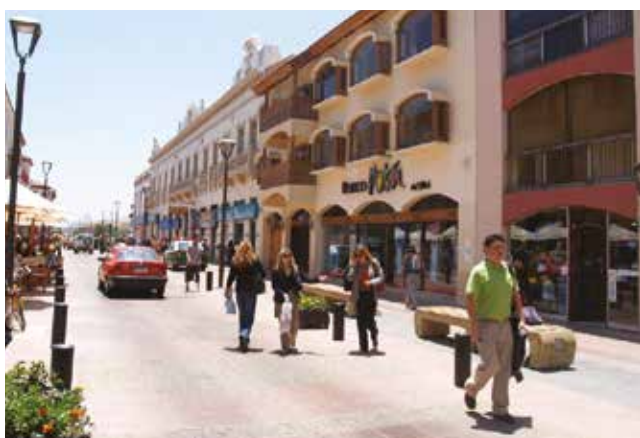
Arriba Plaza de Abastos "La Recova". Centro Dulces típicos de la comuna. Abajo Centro cívico de La Serena.