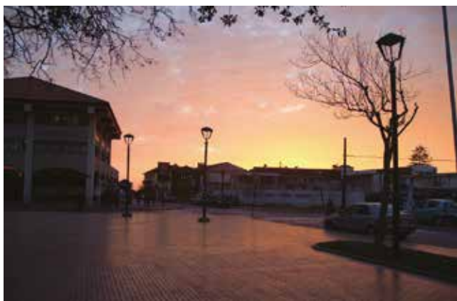
Arriba Pileta Plaza de Armas La Serena. Abajo Atardecer centro de la ciudad.