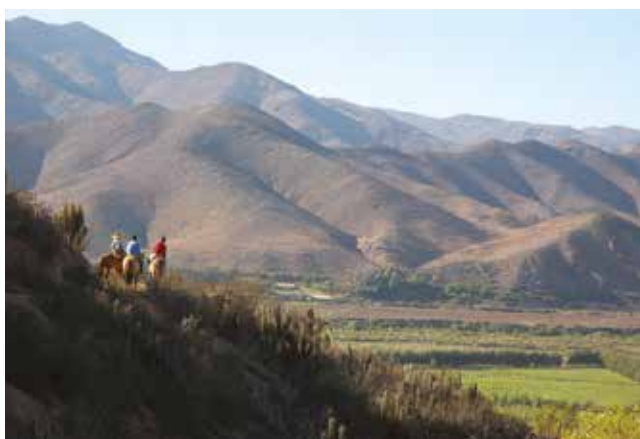
Arriba La papaya, fruto típico de esta zona. Centro Observatorio Cerro Mayu. Abajo Panorámica del paisaje rural de La Serena.