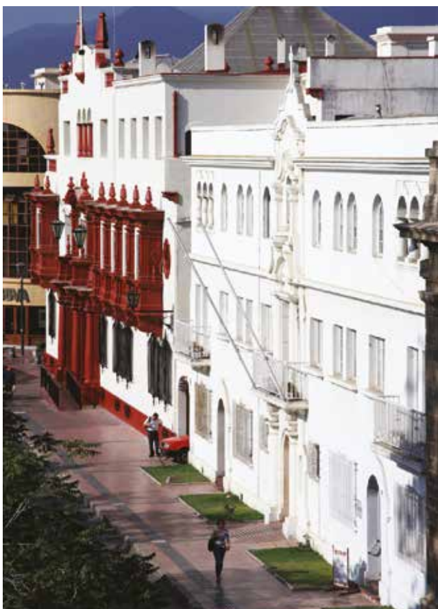
Arriba Panorámica de Jardín Japonés. Abajo Centro histórico de La Serena.