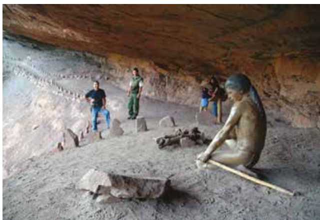
Arriba Vista panorámica del valle. Centro Réplica dinosaurio, Monumento Natural Pichasca. Abajo Alero Rocoso, Monumento Natural Pichasca.