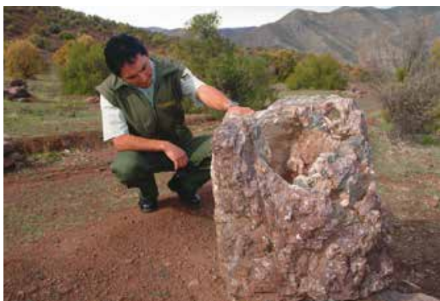
Arriba Productos típicos Río Hurtado. Centro Vista paisajes del valle. Abajo Vestigios bosque petrificado, Sendero de Chile.