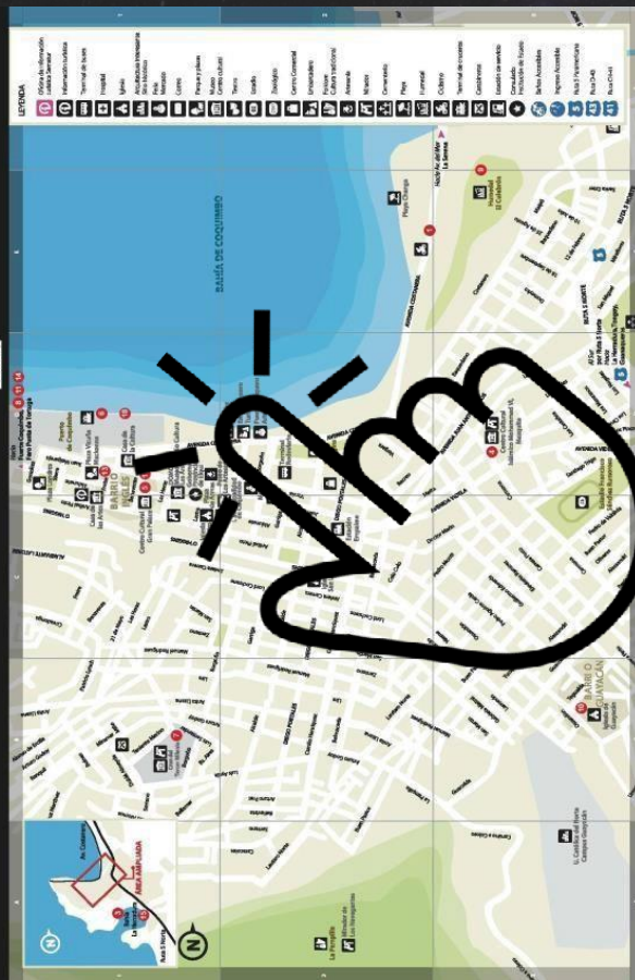
Plano Coquimbo / City Map