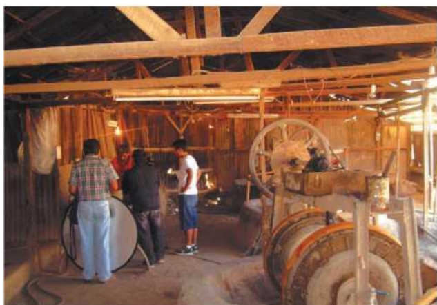
En haut l'Observatoire astronomique Collowara. Au centre Intérieur salle muséographie Yahuín. En bas Trapiche le Salitre.