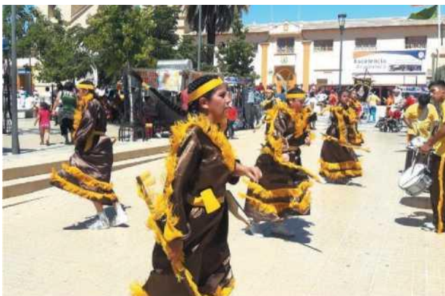
Fête Grande Notre Dame d'Andacollo.

L'artisanat. Il existe un artisanat traditionnel fabriqué en pierre andacollita et avec d'autres pierres ornées de miniatures en bronze imitant les outils des mineurs. Les plaques religieuses de la fête d'Andacollo fabriquées en métal sont également typiques.