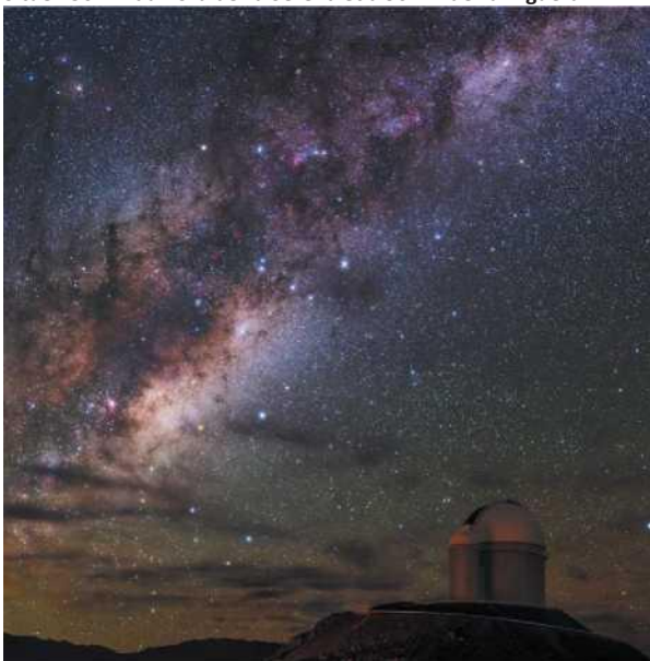
En haut: Ciel nocturne dans l'Observatoire La Silla.

9 Situé 156 km au nord de La Serena et à 96 km de La Higuera.