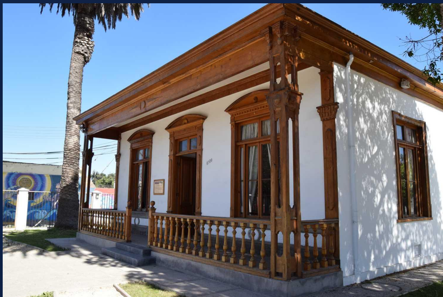
Casa de Gabriela Mistral de Las Palmeras, La Serena

La Ruta Patrimonial Gabriela Mistral es un recorrido cultural y turístico que recorre los lugares emblemáticos relacionados con la vida y obra de Gabriela Mistral, una de las figuras literarias más importantes de Chile y América Latina. Esta ruta busca difundir su legado poético y humano, permitiendo a los visitantes conocer en profundidad la historia, el contexto y las experiencias que influyeron en su creación literaria.