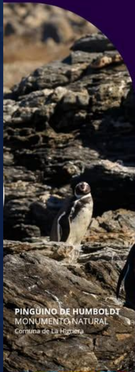
PINGÜINO DE HUMBOLDT MONUMENTO NATURAL Comuna de La Higuera