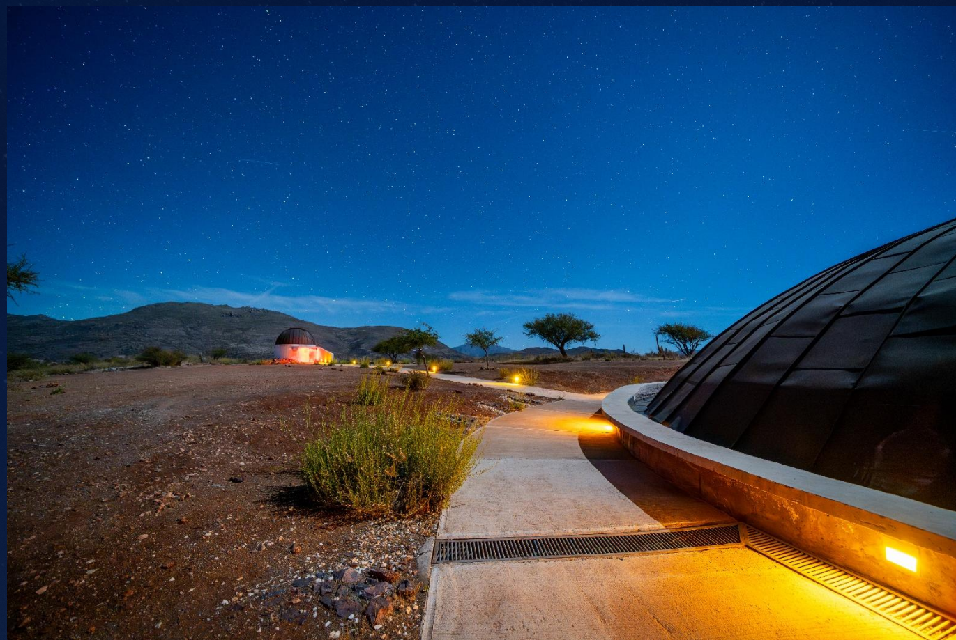
Observatorio Cruz del Sur, Combarbalá